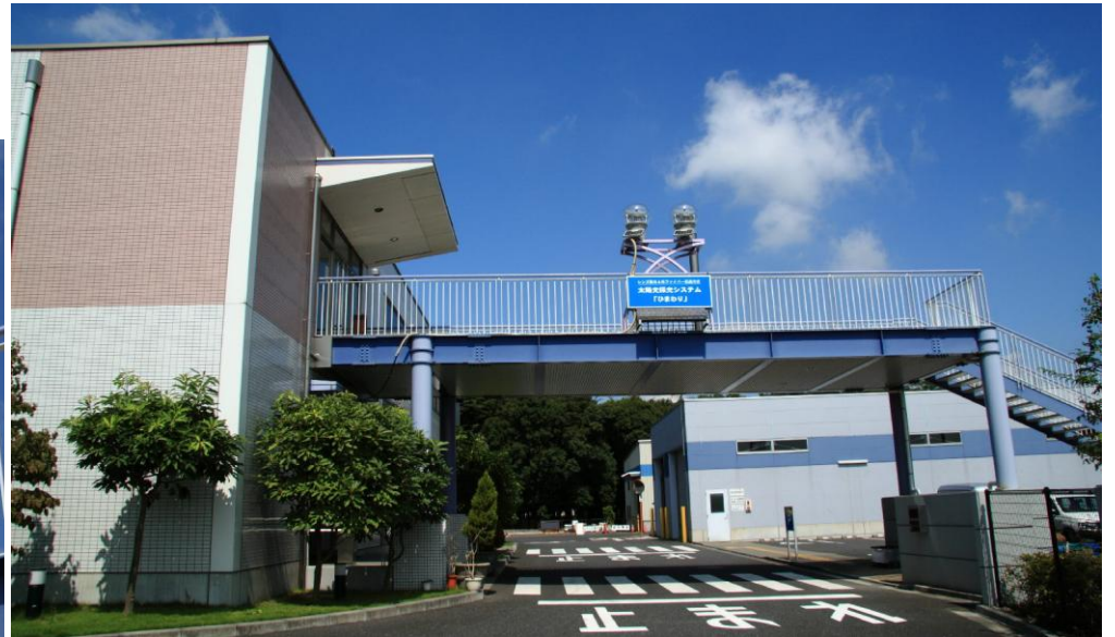
【リサイクルプラザ外観】