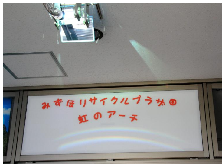
【プリズムを使い虹を演出】