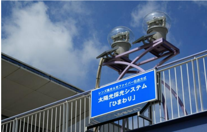
【太陽電池仕様の12眼集光装置】