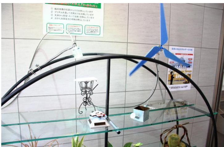
【太陽光でおもちゃを動かす】